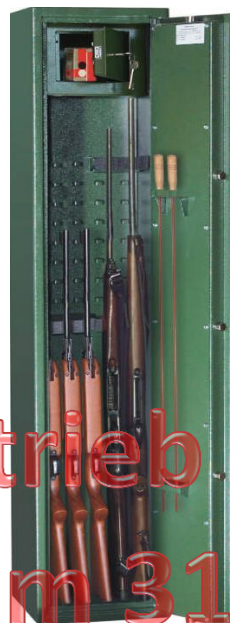
TG WA-10 (Abb. ähnlich)